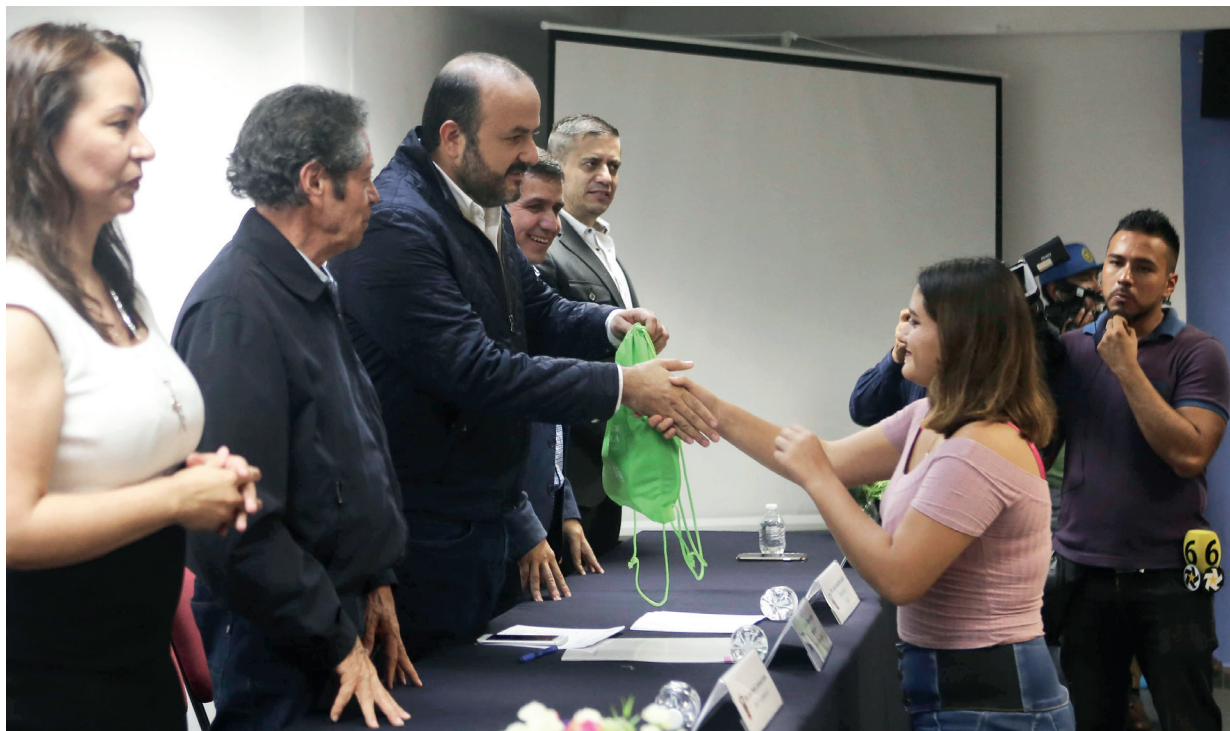
Entregaron kits a los estudiantes del Semestre Base para despertar su identidad y cariño para la institución.