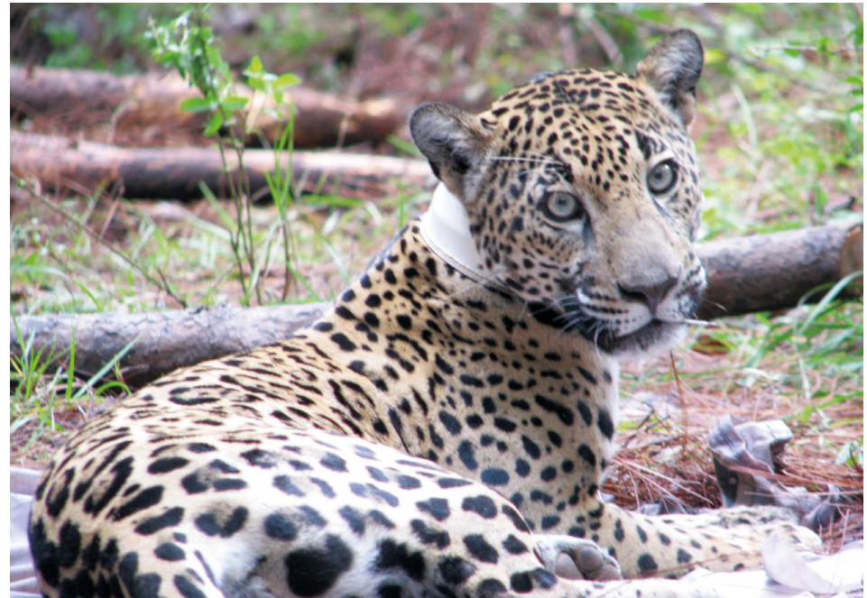
Analizaron 60 muestras de heces de felinos y algunos caninos.

“Esto es realmente algo nuevo, lo de los pesticidas en los felinos, trabajamos a través de sus excretas, porque atrapar a los animales silvestres para muestras de sangre u orina es muy complicado. Y de ahí podemos identificar qué tipo de felinos son y la cantidad de pesticidas; es un