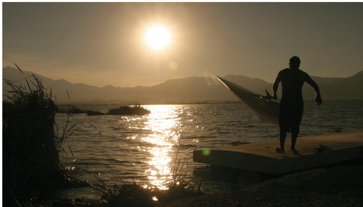
El de Zapotlán es un lago vivo por su biodiversidad y porque en él se realizan actividades amigables.

El Lago de Zapotlán, en Ciudad Guzmán, aunque sigue padeciendo de varios tipos de contaminación y los cambios de uso de suelo, mantiene sus características ambientales que son reconocidas internacionalmente