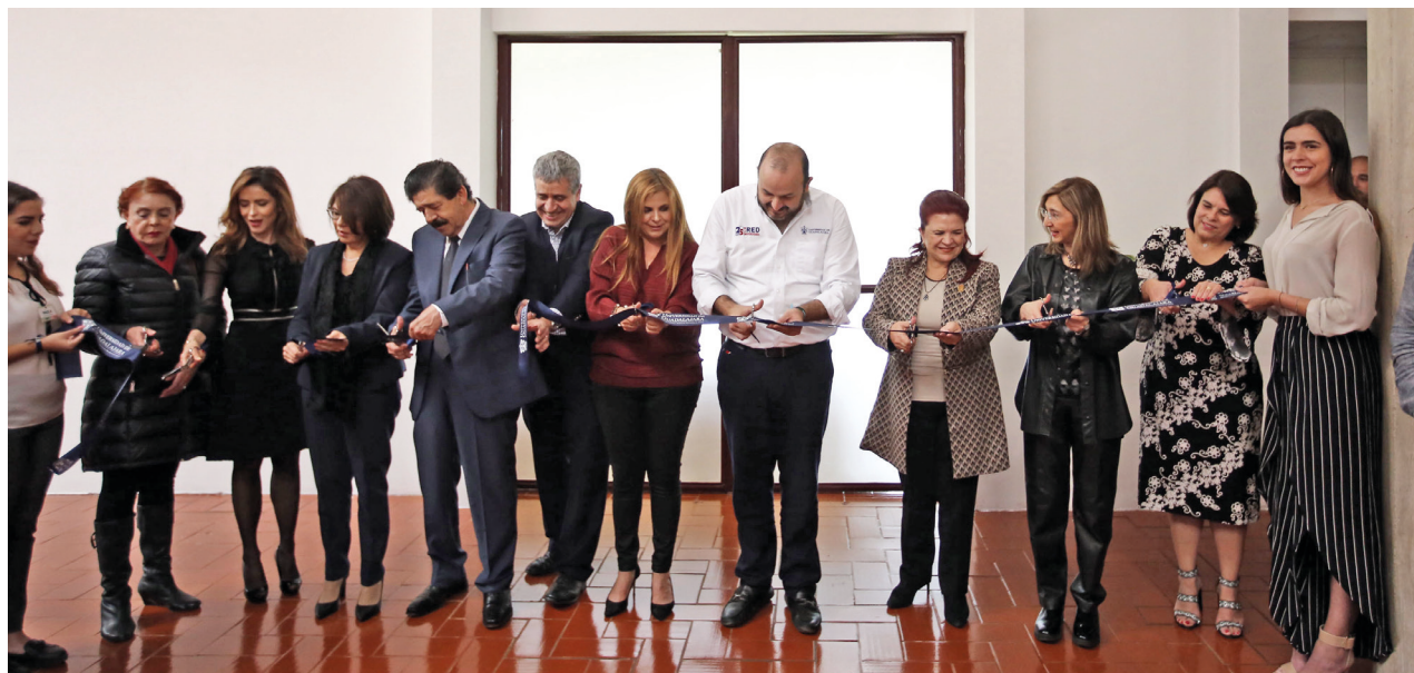
Inauguración de la Sala de Ex rectores en el CUALtos.

Los festejos se concluyeron en la tarde con la presentación del Ballet Folclórico de la UdeG, dirigido por Carlos Ochoa. ♦