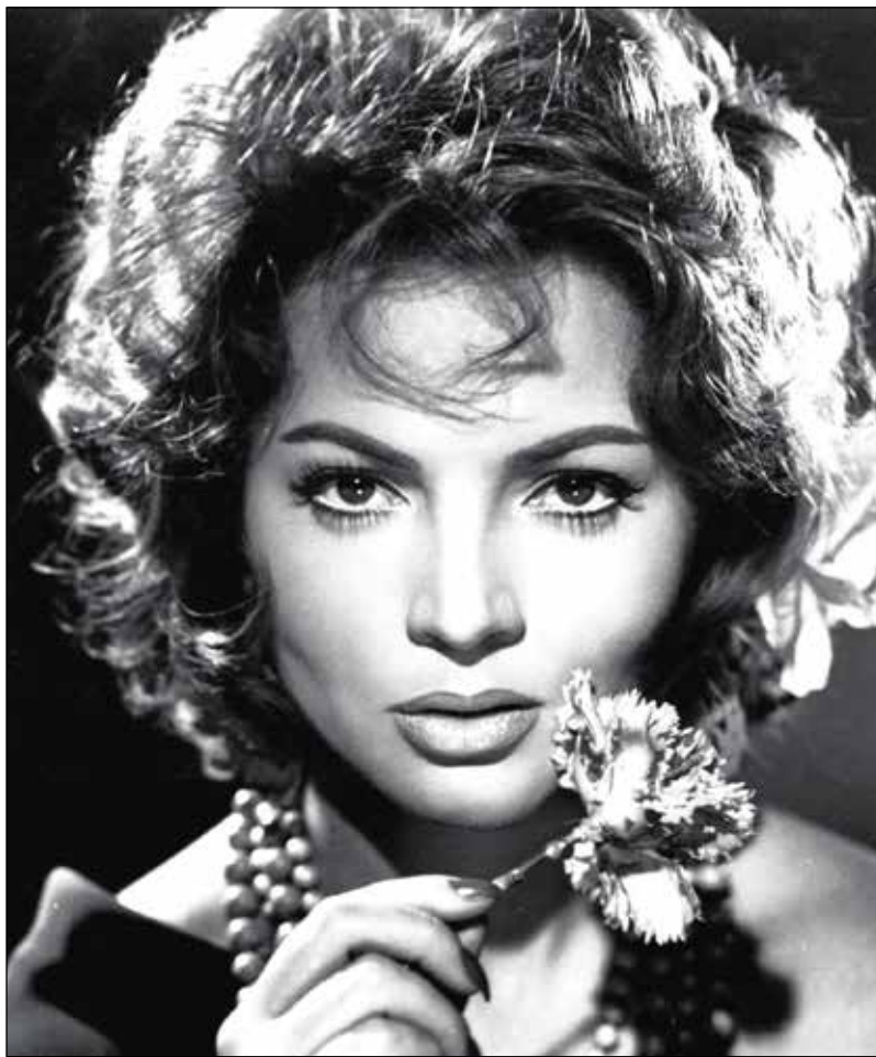
◀ La actriz española falleció a los 85 años de edad.