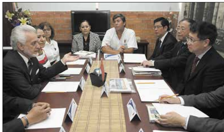
► En reunión autoridades universitaria y comitiva de la ciudad de Shanghai.