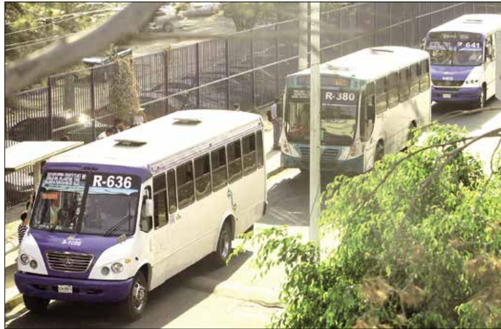
▲ Actualmente en la ciudad hay varias rutas que pasan por las mismas avenidas.

“Deben identificarse los corredores de mayor demanda, donde debería haber tren ligero o macrobús. Mientras no haya recursos para construir más rutas de tren ligero o BRT (Sistema de autobús de tránsito rápido), lo ideal sería meter ahí vehículos de alta especificación, alimentados por el resto de las rutas. Se trata de un sistema troncal, en el que las demás rutas que haya en la ciudad deben ser ordenadas como alimentadoras”, afirma Arreola Chávez.