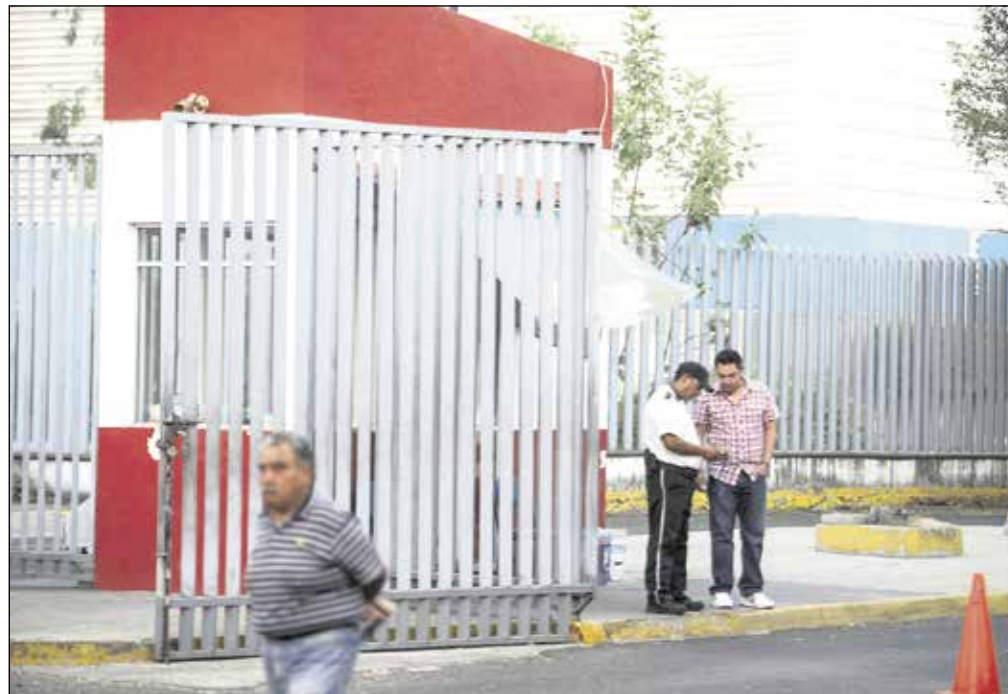
▲ Puerta de acceso al Centro Universitario de Ciencias Exactas e Ingenierías.

“En cuanto a entorno seguro, hay que mantener el perímetro de