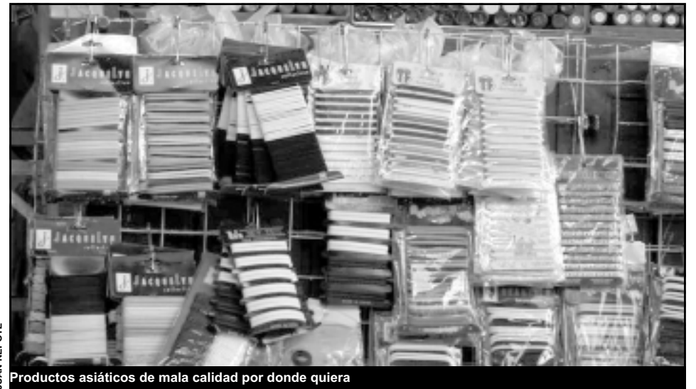
Productos asiáticos de mala calidad por donde quiera

En primer lugar, hablemos del bajo precio de comercialización. En nuestro entorno comercial los recursos que el empresario destina para hacerse llegar hasta su planta materiales, o en su caso productos, resulta un costo agregado a los recursos que por naturaleza de su giro tiene que realizar, como pueden ser los valores de los materiales invertidos, los sueldos que por mano de obra deba cubrir, y en su caso, los gastos indirectos de producción para desarrollar y transformarlos en productos terminados, los que posteriormente tendrá que desplazar para su venta y con ello generar los ingresos