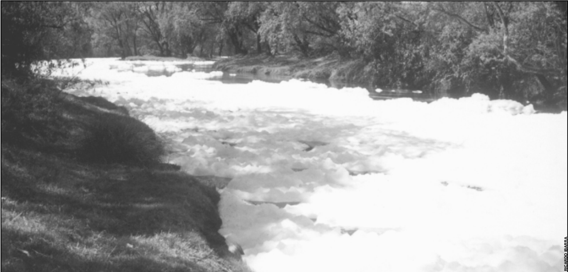
Este es uno de los ríos de la cuenca con elevaciones de espuma blanca

Durante un recorrido realizado por miembros del Comité universitario para el estudio del agua (Acqua) y medios de comunicación locales, se encontraron tomas clandestinas y un alto índice de contaminantes orgánicos y minerales que han perjudicado el ambiente de distintas poblaciones.