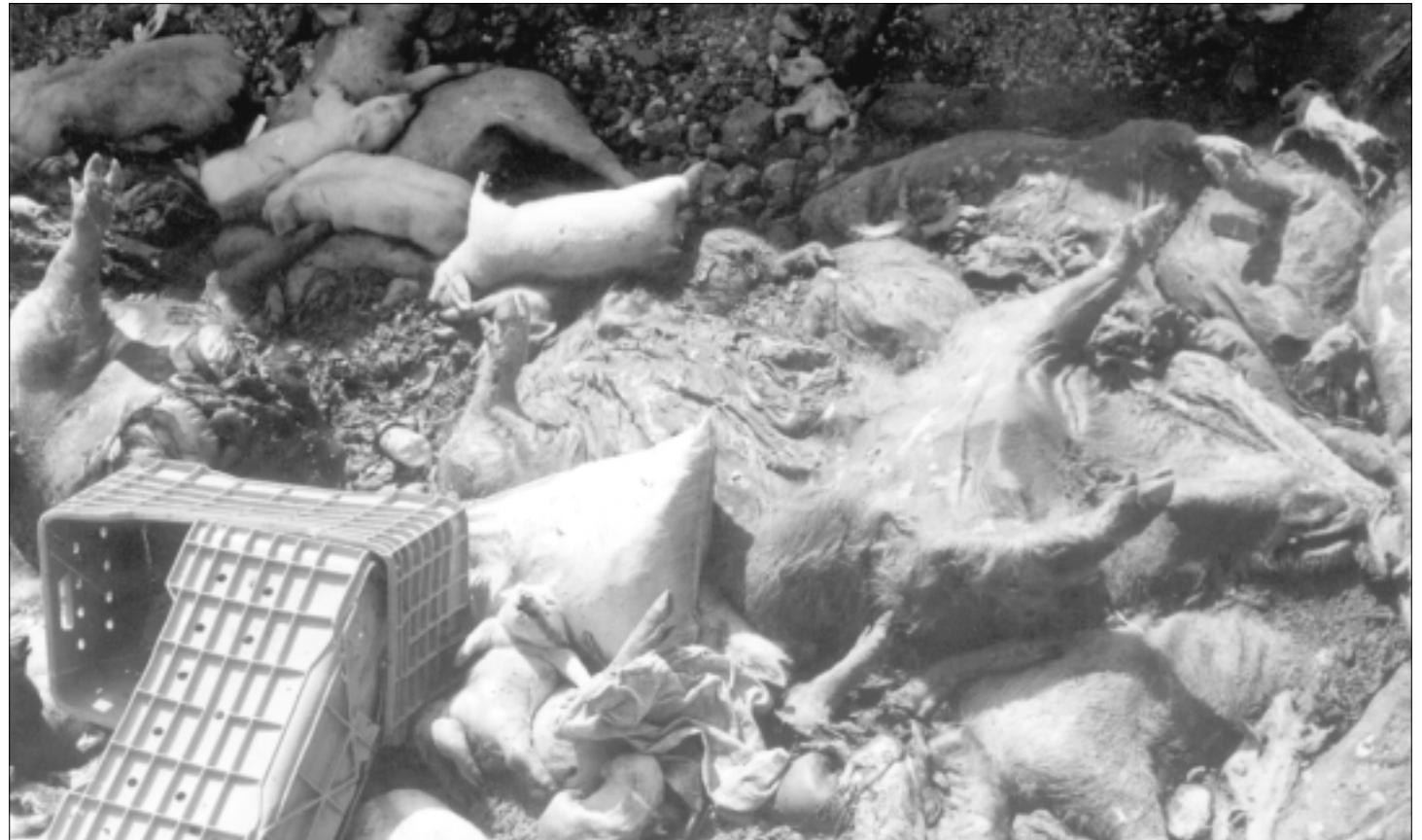
Existen pozos repletos de cadáveres de animales cercanos a la cuenca Lerma-Chapala

En la presa Solís, de Guanajuato, la más grande de la cuenca, observaron que fluía el agua en exceso, que se vierte en los canales de riego de ese estado, lo que revela una falta de