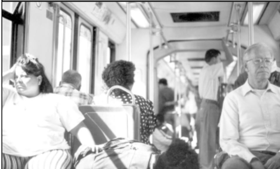
Primero... las maletas