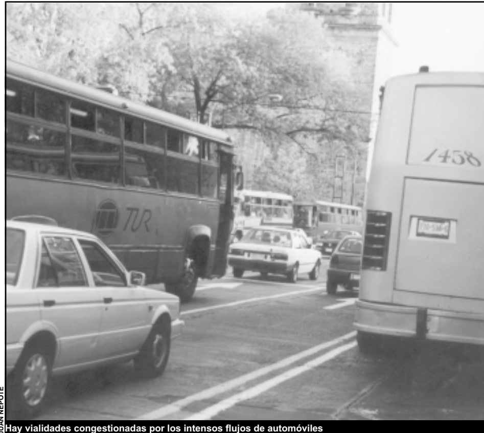
Hay vialidades congestionadas por los intensos flujos de automóviles

La elevada cantidad de rutas que circulan por el área central contrasta con su baja