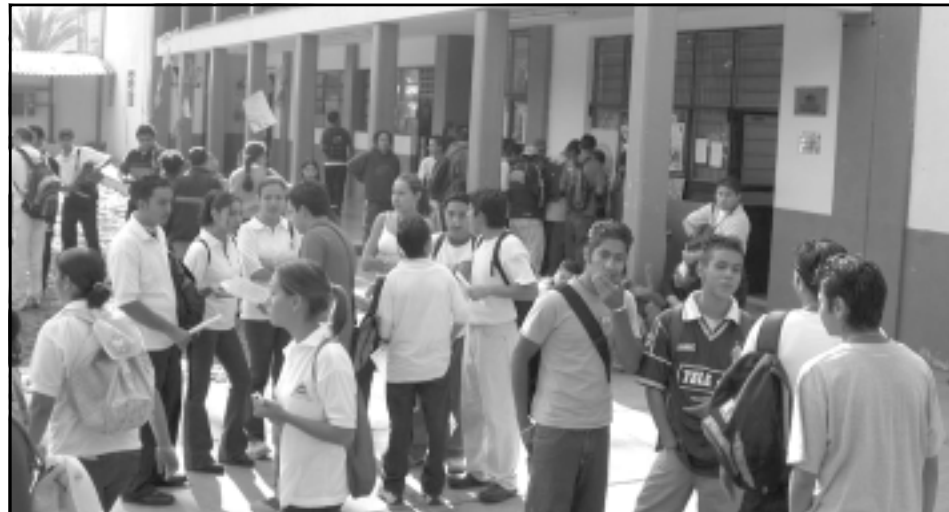
Difunden las carreras técnicas entre los jóvenes de secundaria

A la inauguración de Expolitec asistieron funcionarios de la UdeG, así como representantes de sectores empresariales y productivos.❖