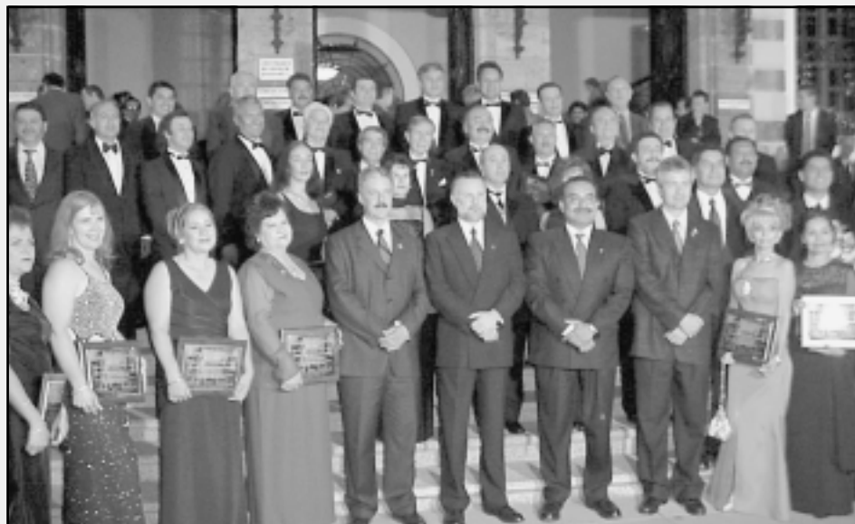
Recibieron homenaje personalidades que laboran en el área de la salud

Desde julio del año pasado, la convocatoria fue extensiva a los médicos de todos los hospitales y universidades de Jalisco. ♦