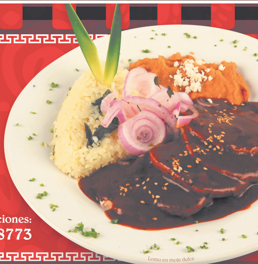
Lomo en mole dulce