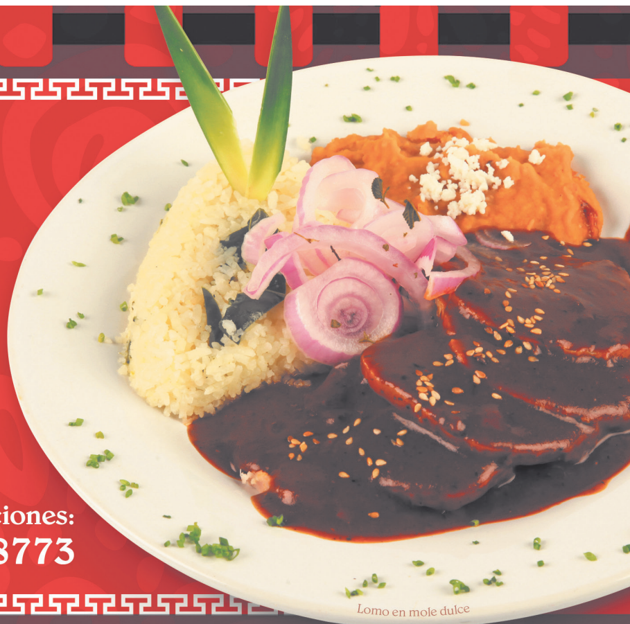
Lomo en mole dulce

AV. AMÉRICAS 1417-B, COL. PROVIDENCIA WWW.CLUBCENTRAL.COM.MX