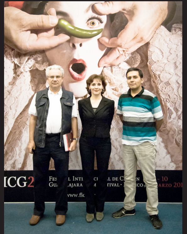
▶ Jurado Fipresci.