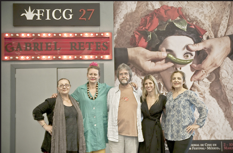
◀ Jurado de cortometrajes.