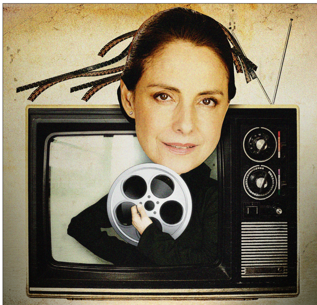
Ilustración: Orlando López

Diana Bracho es parte de esa estirpe de grandes glosadoras mexicanas que han ayudado a expandir nuestra percepción de la realidad nacional. Los homenajes recibidos en el marco del FICG, premian la sensibilidad de una actriz irrepetible