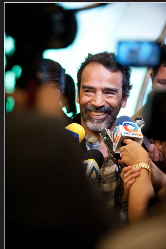
▶ El actor Damián Alcázar.