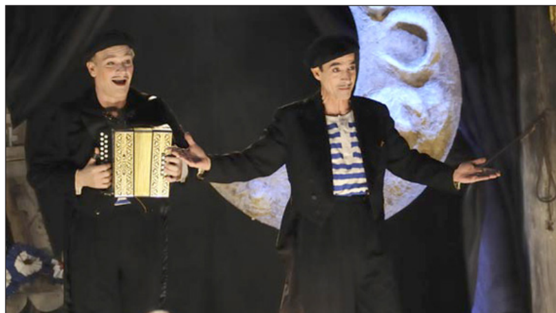
◀ Escena de la cinta Pájaros de papel .