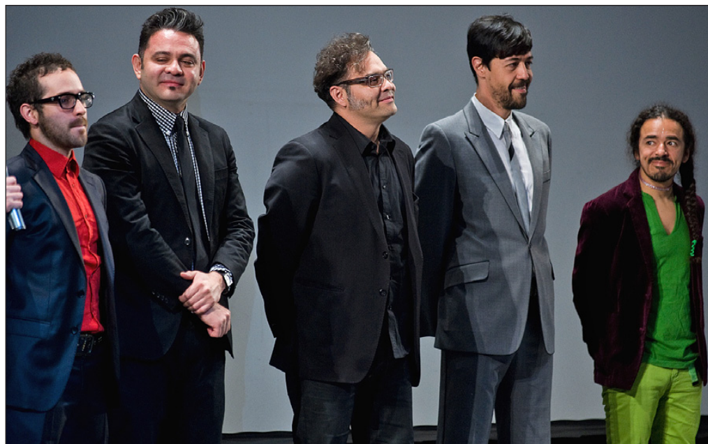
▲ Café Tacvba, en la presentación de Seguir siendo.