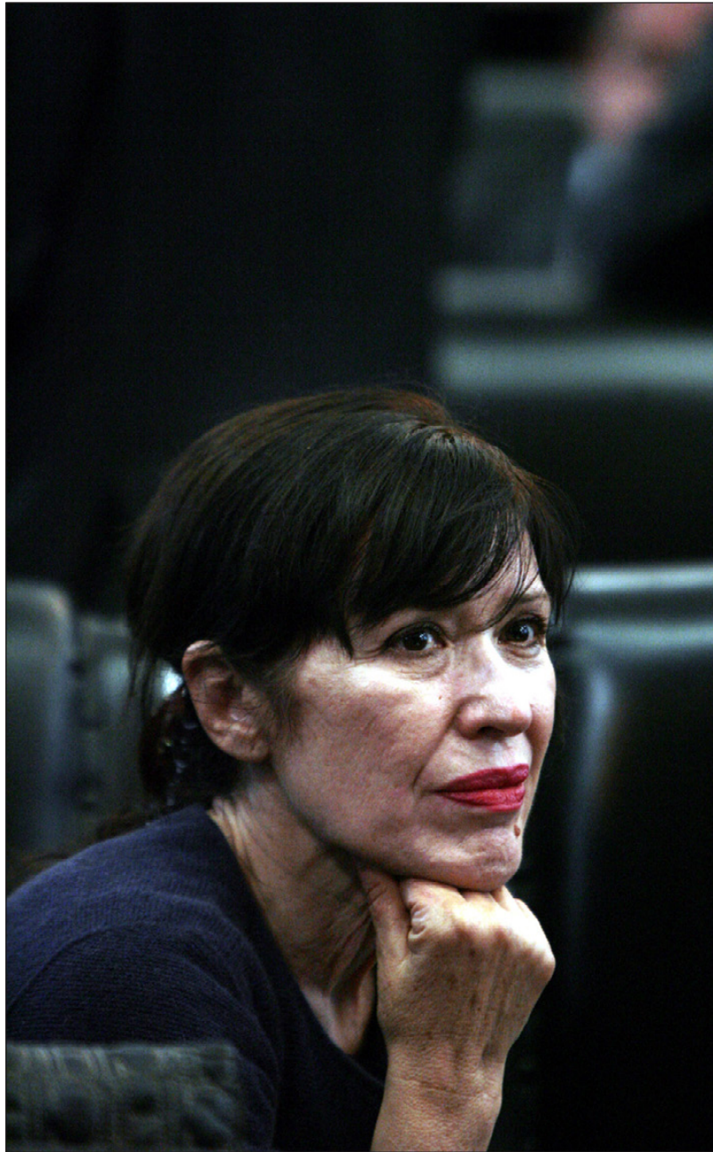
◀ La musa de Jaime Humberto Hermosillo.

Para la actriz mexicana, la lucha por el cine nacional también incluye el tema de la libertad para la exhibición en el cine mexicano. Rojo opina que “la censura es un monstruo que pretende ocultar las verdades. Así como ha habido libertad de expresión, también la censura se ha posado como una creación de mentes siniestras que pretenden ocultar la