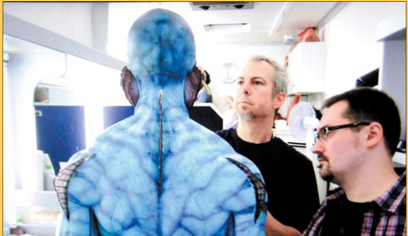
▲ Sesión de maquillaje dentro del rodaje de la película Hellboy II .

Luego la Caja de Ahorro del Mediterráneo y el equipo de efectos especiales DDT, nos propusieron hacer algo totalmente digital. Un concepto atípico, dúctil, con posibilidades de meter a la exposición más material y mostrar todo el proceso de las pe-