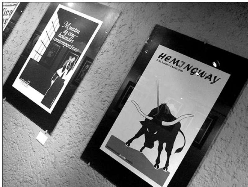
Parte de la muestra de afiches que se exhibe en el Cineforo.