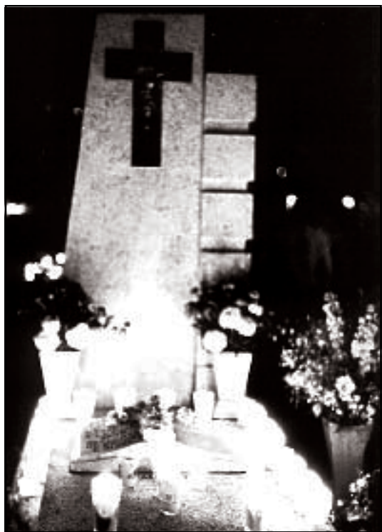
Celebrar el día de muertos es ya una tradición

Es importante destacar que esta conducta no pertenece a una religión en especial. Muchos mexicanos independientemente de sus creencias, han adoptado la tradición de celebrar a sus muertos. ♦