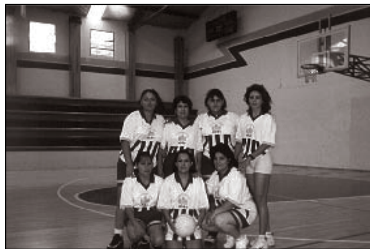
Equipo de Voleibol de trabajadoras de la UdeG

Se invita a todos los trabajadores administrativos de esta casa de estudios a formar parte de estas selecciones y conformar otras más, pero en las demás disciplinas deportivas. Los interesados podrán dirigirse a las oficinas del sutudeg, ubicadas en Escorza 169, con Gregorio Vázquez Villegas. ♦