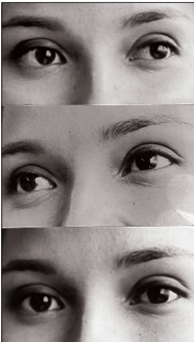
Actualmente existen dos mil 500 personas en espera de un transplante corneal

* Acerca de este fenómeno, los especialistas afirman que médicamente es imposible, ya que para hacer un transplante se requiere de mucha infraestructura y tecnología hospitalaria.