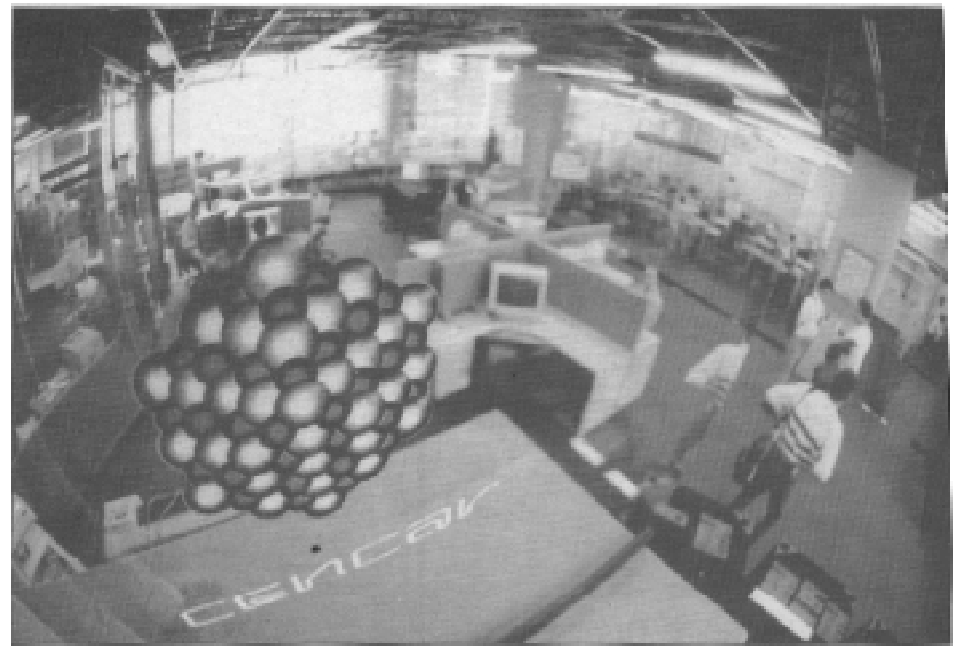
Instalaciones del Centro de Cómputo de Alto Rendimiento

Dos supercomputadoras son de los principales atractivos en esta dependencia. Una de ellas puede ejecutar hasta 2.4 miles de millones de operaciones de punto flotante por segundo; tiene ocho