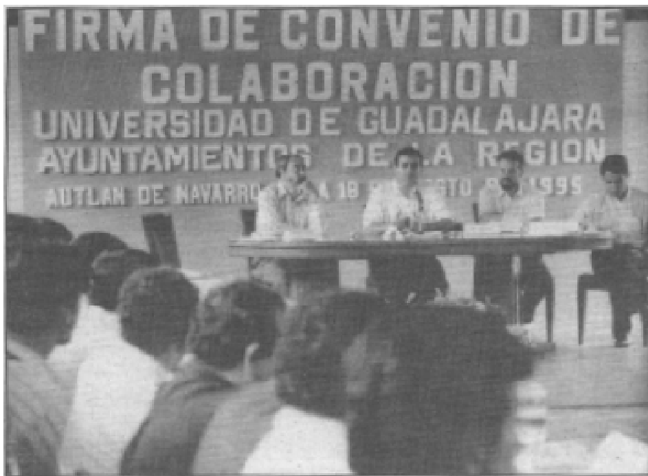
Se amplía la vinculación universitaria