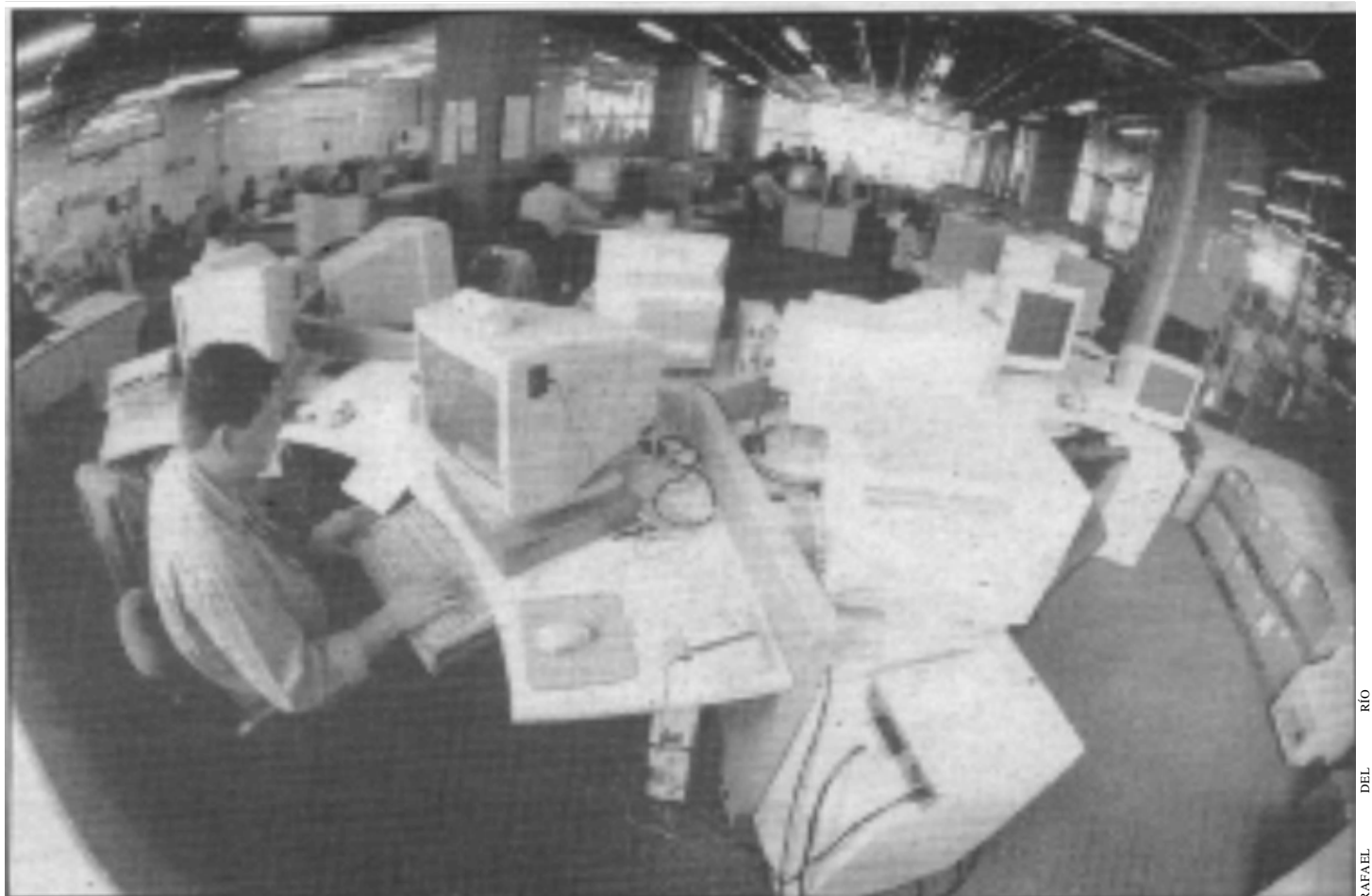
Hoy en día se tienen más de 300 usuarios externos de la Red Internet que parte de este Centro de cómputo

Para terminar, el director del Cencar resolvió la curiosidad que propios y extraños tienen sobre la construcción que se realiza afuera del edificio Cultural y Administrativo. "Esta acción tiene el fin de proteger el aire acondicionado del centro de cómputo, evitar la infiltración de la lluvia y darle una mayor estética al edificio".