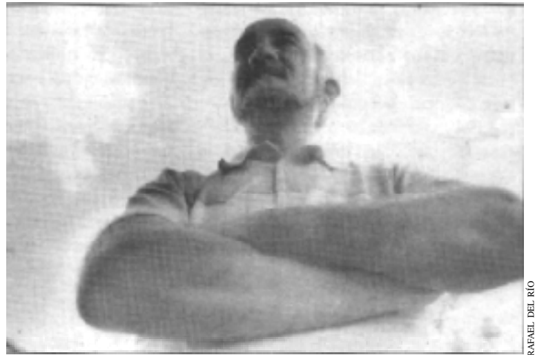
Raúl Aceves, brazo fuerte de la poesía jalisciense