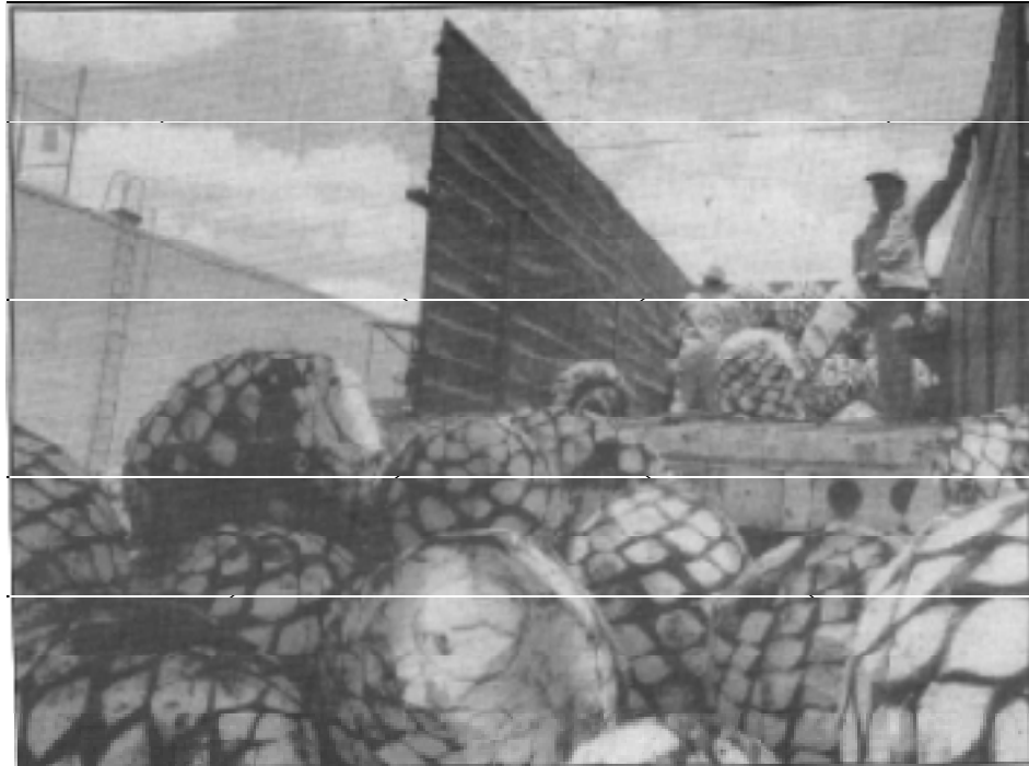
Los productores deben ver el agave como un recurso estratégico para el desarrollo regional de Jalisco y México